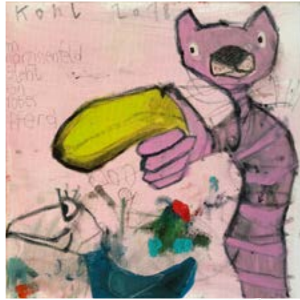
"very stable genius"