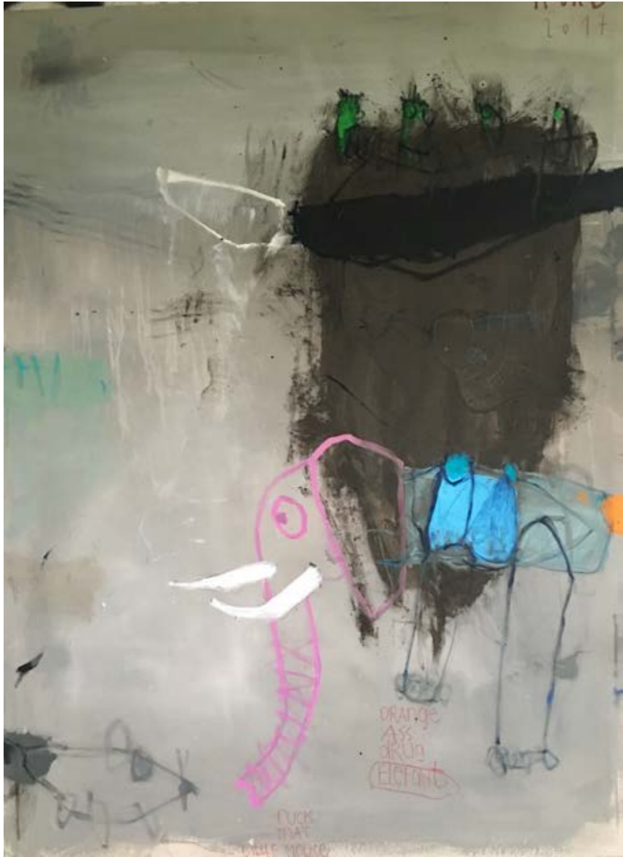
"Am blattrAnd..." Mt/Leinen, 40 x 40 cm