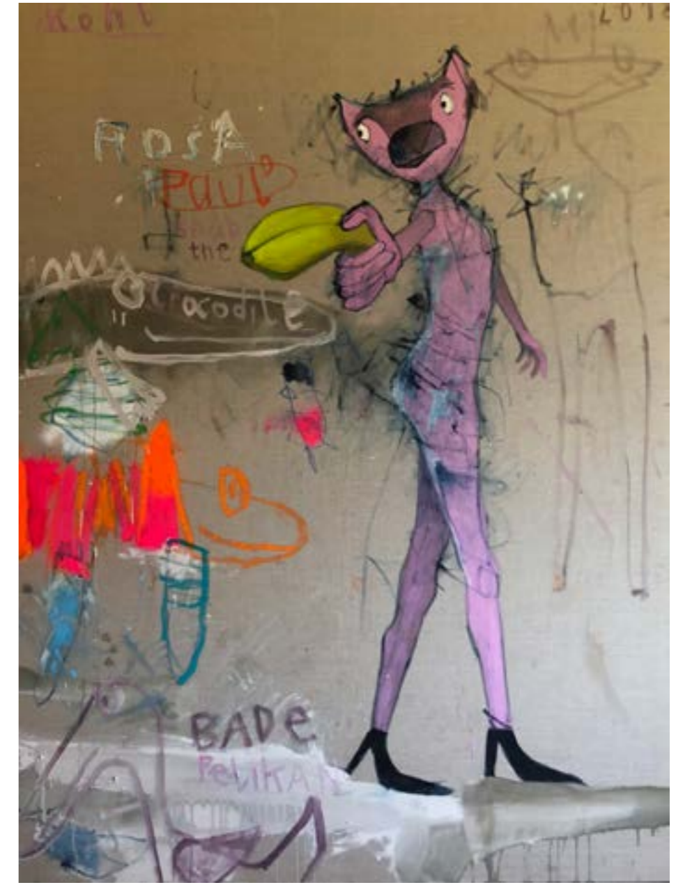
"Am blattrAnd..." Mt/Leinen, 40 x 40 cm