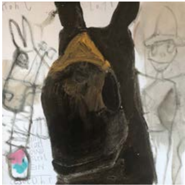
"very stable genius"